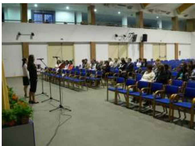
FEVA Mandala Dalszínház előadása