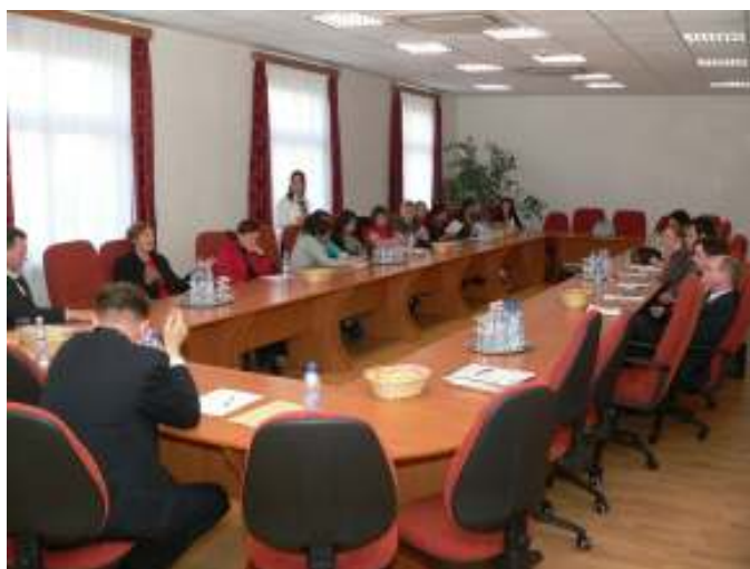
STTI alakuló ülés