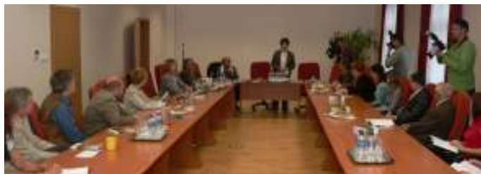
Kép a tanulmány kötet bemutatójáról, sajtótájékoztató