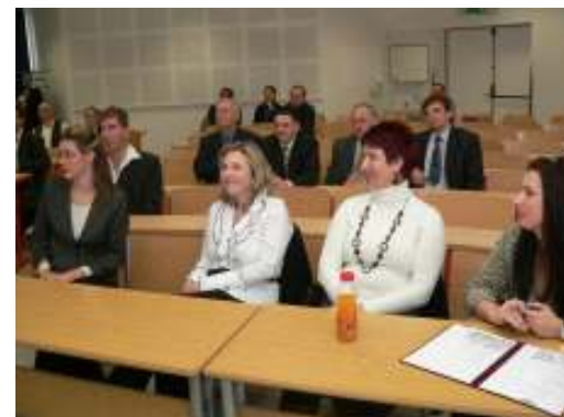
Kapcsolat Napja, amelyen előadást tartott a fenti cikkekben szereplő két oktatónk