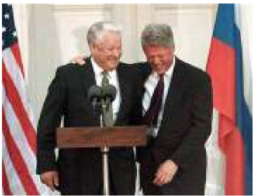
Borisz Jelcin és Bill Clinton

Az év azzal kezdődött, hogy a magyar állampolgárok korlátozás nélkül vásárolhattak külföldi valutát. Megkezdődött Bill Clinton amerikai elnök második ciklusa. Bill Clinton amerikai elnök és Borisz Jelcin orosz el-