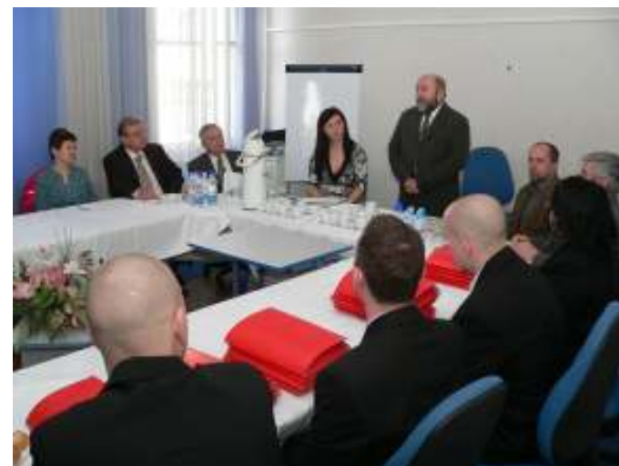
TDK előkészítő bizottsági ülés