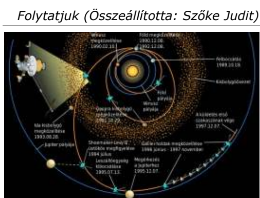
Galileo űrszonda életútja

Folytatjuk (Összeállította: Szőke Judit)