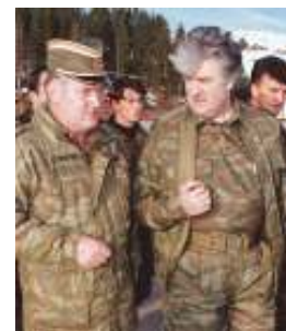
Radovan Karadzic és Ratko Mladic

Júliusban ismét Borisz Jelcint választották meg az Oroszországi Föderáció elnökévé.