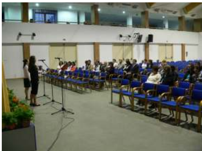
FEVA Mandala Dalszínház előadása