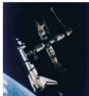
Atlantis csatlakozik a Mir űrállomáshoz

Tudomány: Augusztus 6-án a NASA bejelenteti, hogy az ALH84001 meteorit, mely a Marsról származik, primitív életformák nyomait tartalmazza. A Saccharomyces cerevisiae élesztő genomjának géntérképe elkészült, ez az első eukarióta genom, melynek genetikai állománya teljesen ismertté vált. Január 30-án felfedezik a Hyakutake üstököst. Február 17-én a NEAR Shoemaker űrszondát elindítják. A 433 Eros kisbolygóra szállt le 2001-ben. Május 20-án lezajlik a Hale-Bopp üstökös első szabad szemmel történő megfigyelése. Február 13-án elkészül a világ legmagasabb épületének, a Kuala Lumpurban található 460 méter magas Petronas ikertoronynak a szerkezete. Január 7-én az USA keleti részén több mint 100 embert öl meg egy vihar. Július 18 és 21 között viharok súlyos áradást keltenek a Saguenay-folyón Quebec-ben, Kanada egyik legsúlyosabb természeti katasztrófáját okozva ezzel. Április 22: Franciaországban bemutatják az APS rendszerű intelligens fényképezőgépet, mely minden beállítást önműködően végez. Nobel díjasok: Fizikai: David M. Lee, Douglas D. Osheroff, Robert C. Richardson.