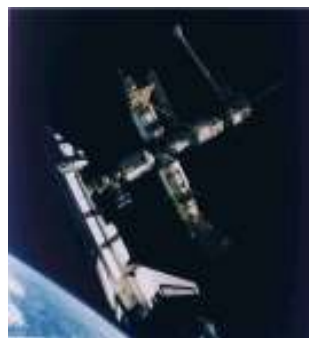
Atlantis csatlakozik a Mir űrállomáshoz

Tudomány: Augusztus 6-án a NASA bejelentette, hogy az ALH84001 meteorit, mely a Marsról származik, primitív életformák nyomait tartalmazza. A Saccharomyces cerevisiae élesztő genomjának géntérképe elkészült, ez az első eukarióta genom, melynek genetikai állománya teljesen ismertté vált. Január 30-án felfedezik a Hyakutake üstököst. Február 17-én a NEAR Shoemaker űrszondát elindítják. A 433 Eros kisbolygóra szállt le 2001-ben. Május 20-án lezajlik a Hale-Bopp üstökös első szabad szemmel történő megfigyelése. Február 13-án elkészül a világ legmagasabb épületének, a Kuala Lumpurban található 460 méter magas Petronas ikertoronynak a szerkezete. Január 7-én az USA keleti részén több mint 100 embert öl meg egy vihar. Július 18 és 21 között viharok súlyos áradást keltenek a Saguenay-folyón Quebec-ben, Kanada egyik legsúlyosabb természeti katasztrófáját okozva ezzel. Április 22: Franciaországban bemutatják az APS rendszerű intelligens fényképezőgépet, mely minden beállítást önműködően végez. Nobel díjasok: Fizikai: David M. Lee, Douglas D. Osheroff, Robert C. Richardson.