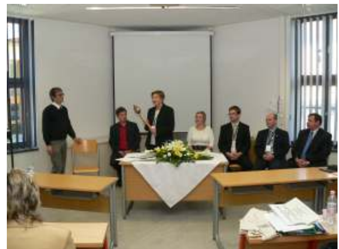
FEVA Vándorbot átadás