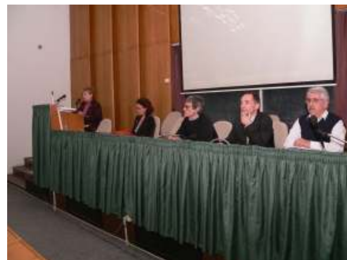
"Utcakép 2010" konferencia