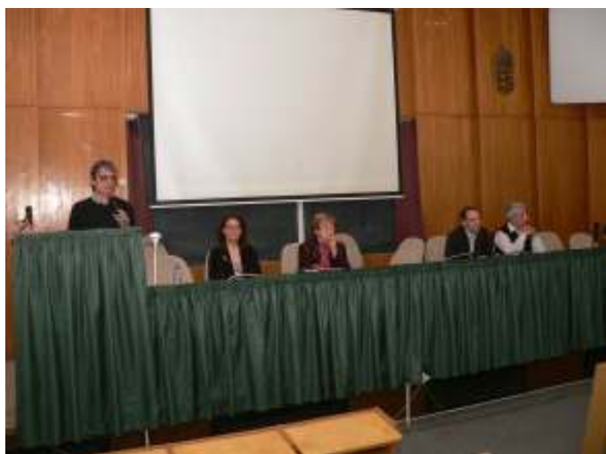
"Utcakép 2010" konferencia