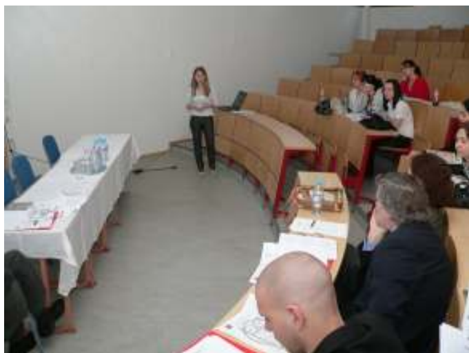
Társadalomtudományi Szekció II.