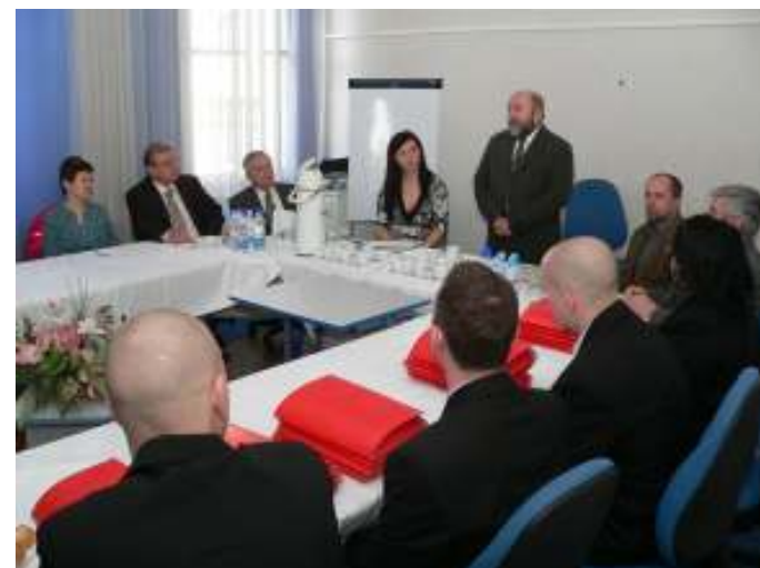
TDK előkészítő bizottsági ülés