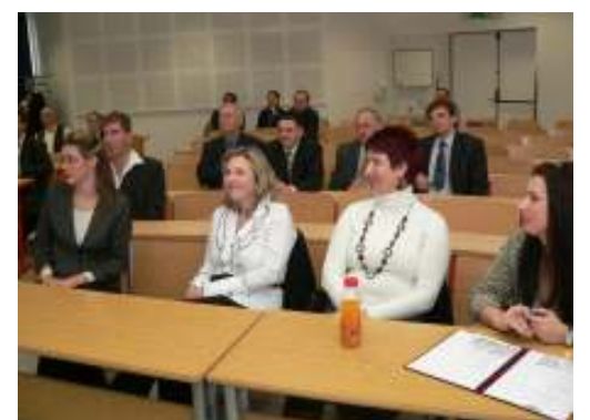
Kapcsolat Napja, amelyen előadást tartott a fenti cikkekben szereplő két oktatónk