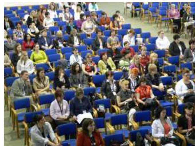
Képek a FEVA kongresszusról