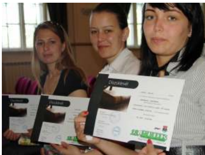
Nagyvárad TDK-án részt vett hallgatóink