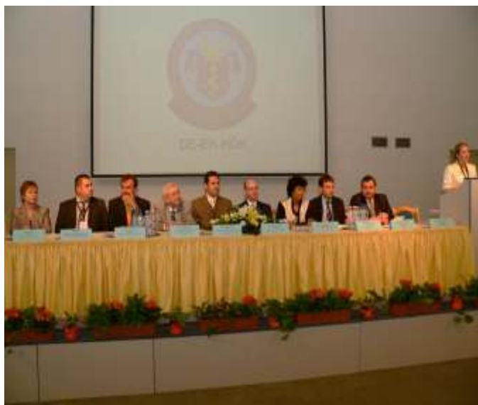
FEVA Plenáris ülés