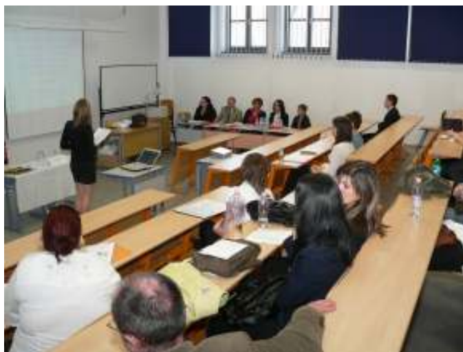
Egészségtudományi Szekció I.