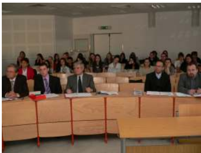
Társadalomtudományi Szekció I.