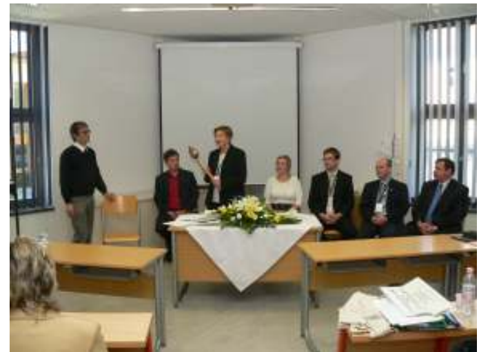
FEVA Vándorbot átadás