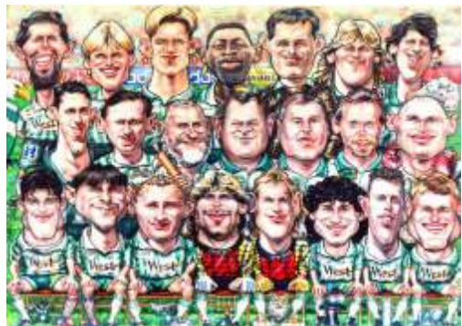
FTC BL 1995 Karikatúra