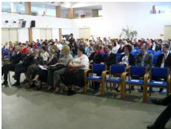
Képek a FEVA kongresszusról