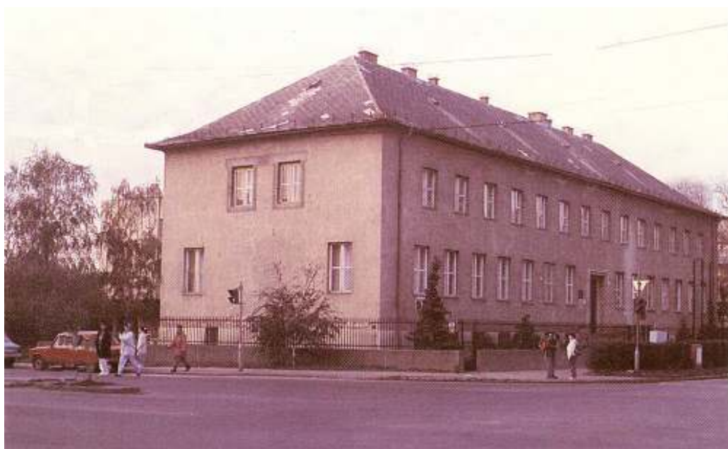
Főépület - felújítás előtt