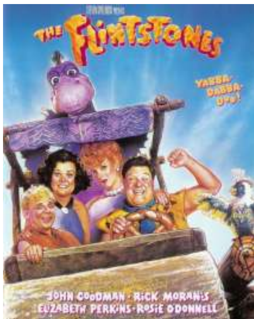
A Flintstones c. film plakátja

A háromszoros Formula-1-es világbajnok brazil Ayrton Senna halálos balesetet szenved az imolai versenyen. Egy nappal korábban az osztrák Roland Ratzenberger is életét veszti az edzésen. A Kispest-Honvéd BL selejtezőn szoros mérkőzéseken kap ki a Manchester United-től (Kispest HFC-Manchester Utd. 1-2, 2-3)