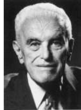
John C. Harsanyi