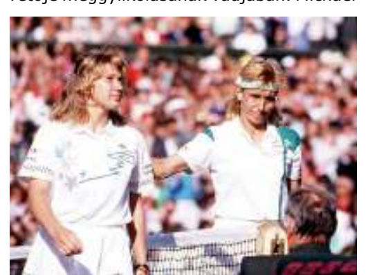
Steffi Graf és Martina Navratilova

Schumacher a Benetton-Ford színeiben megszerzi első Forma-1-es világbajnoki címét Damon Hill (Williams-Renault) előtt.