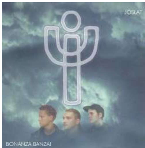
Bonanza Banzai 1994-es Jóslat c. albuma

Folytatjuk (Összeállította: Bodnár-Tóth Bea)