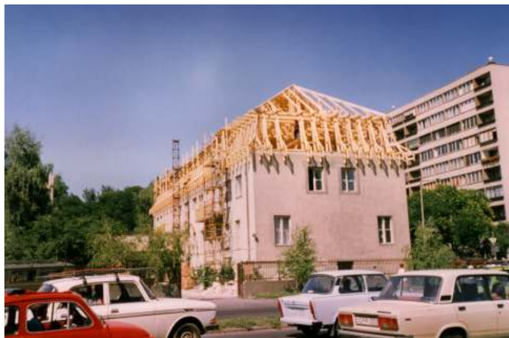
Főépület felújítás, bővítés