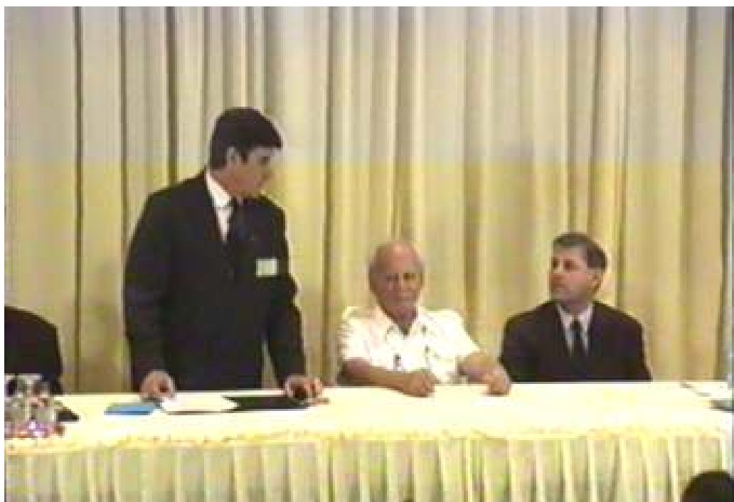
Göncz Árpád látogatása főiskolánkon