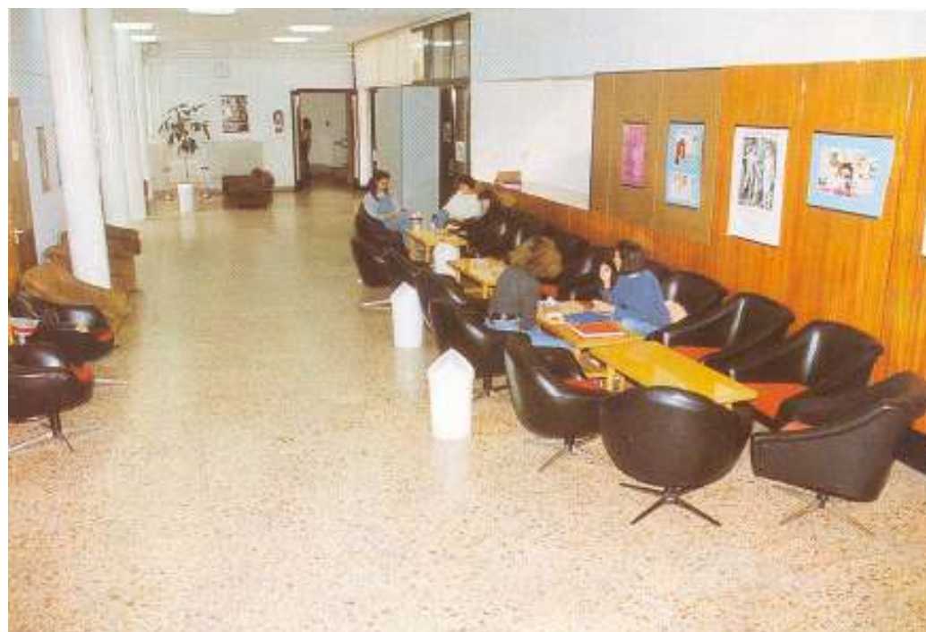
A régi főiskola aulája