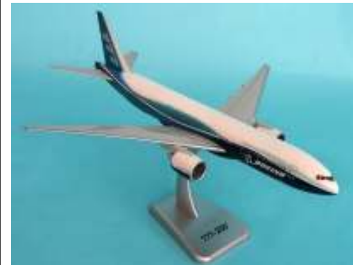
Boeing 777-es utasszállító repülőgép

A Csatorna-alagút, melyet 15 000 munkás épített meg 7 év alatt, megnyílik Anglia és Franciaország között. A két ország