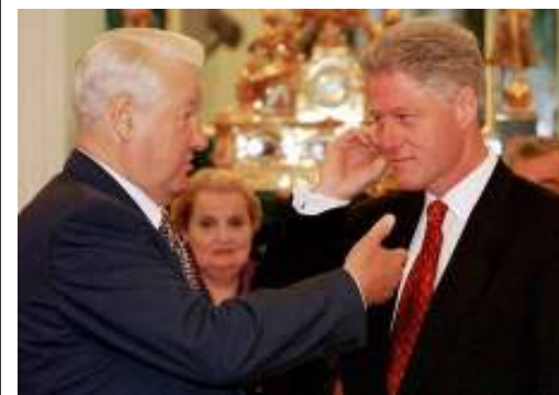
Bill Clinton és Borisz Jelcin

rohant a Nyíregyházáról Budapest-Nyugati pályaudvarra tartó gyorsvonat. A baleset 31 halálos áldozatot, és 54 sebesültet követelt.