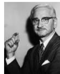
Albert Bruce Sabin

A NASA elveszti a kapcsolatot a Magellán űrszondával.