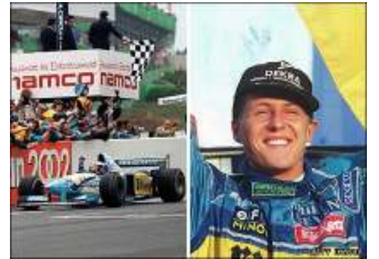
Michael Schumacher Benetton