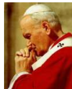
II. János Pál pápa

December 2-án 16:46-kor váltóállítási hiba miatt Szajol vasútállomáson kislított, majd az állomás felvételi épületébe