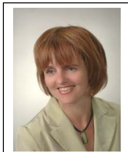
Dorota Kilanska Medical University Lodz