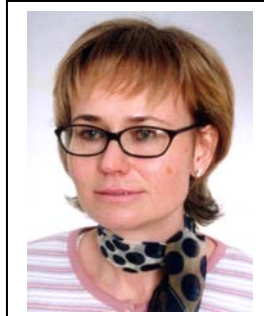
Beata Brosowska Medical University Lodz